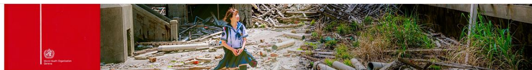
ICF Education.org - Children & Youth