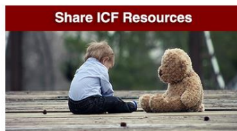
Share ICF Resources