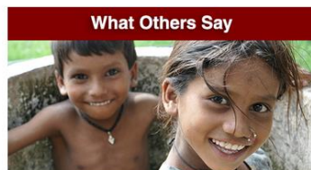
What Others Say