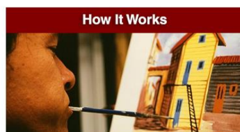
How It Works