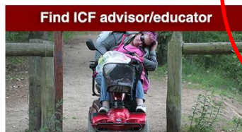
Find ICF advisor/educator