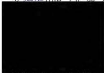
Primátor města Brno