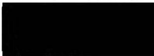
Ředitel ÚZIS ČR