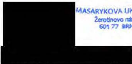
Rektor Masarykovy univerzity

MASARYKOVA UNIVERZITA Žerotínovo nám. 9 601 77 BRNO [1]